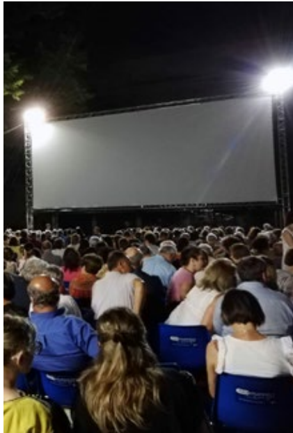
schermo di piazzale Castellina. La rassegna ha inizio con i due titoli che hanno

Per coinvolgere appieno il pubblico è stata introdotta una novità circa le modalità di scelta del programma. I residenti del quartiere hanno contribuito alla selezione degli 8 titoli: grazie ad un questionario, hanno potuto scegliere cosa vedere sullo